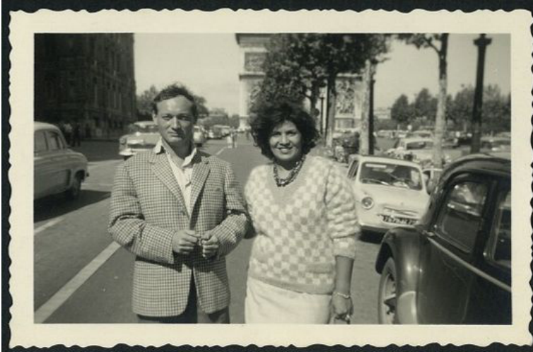
Cziffra György és Soleilka Párizsban

https://www.youtube.com/watch?v=4ugongDo6E8