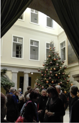
A karácsonyi Aula