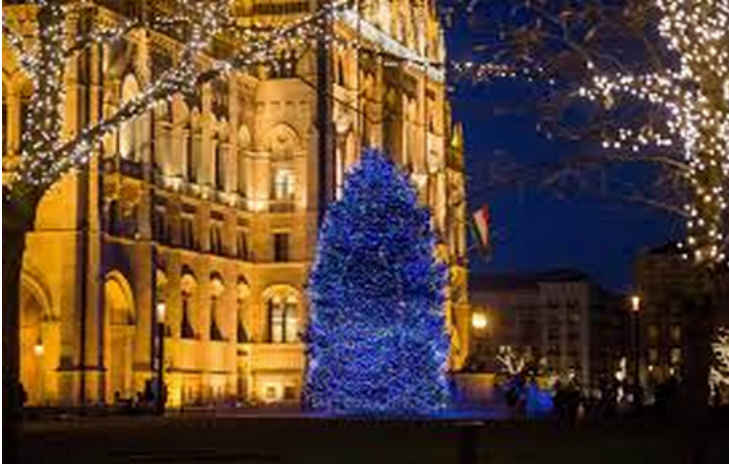
Az ország karácsonyfája 2017.

(Imrétől tudom a színházi mondást: Ami nem sikerült elég jóra, szépre, majd világítással helyrehozzuk!)