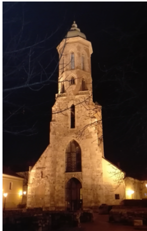
A kivilágított Magdolna-torony, Szabados harangjátékával!